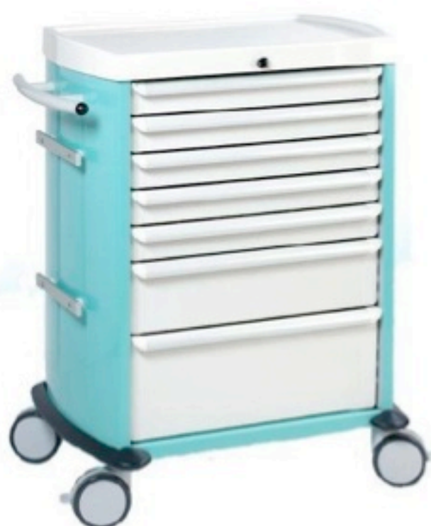
Guéridon livré nu sans accessoires