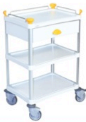
Version 3 plateaux + 1 tiroir