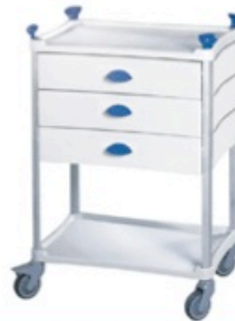
Version 2 plateaux + 3 tiroirs