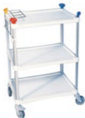
Version 3 plateaux